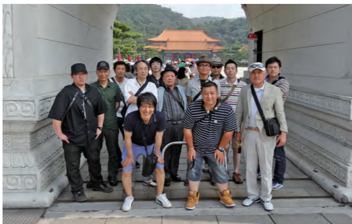
2年に1度の社員旅行で平成28年5月には台湾に行きました。

また、小松建設だけでなく業界全体として「次世代の育成」も課題だと言っ。昔から社員教育には力をいれていて、建